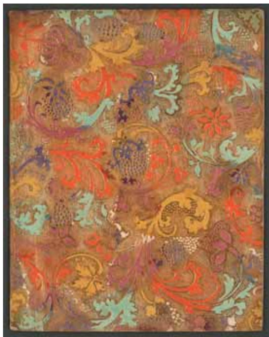
Sammlung Seegers: Brokatpapier (Augsburg um 1735, vermutlich Verlag von Johann Michael Schwibecher), geprägter und gepunzter Goldgrund auf mehrfarbig patroniertem Papier