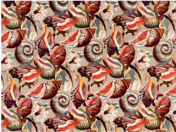
Sammlung Seegers: Fantasiepapier