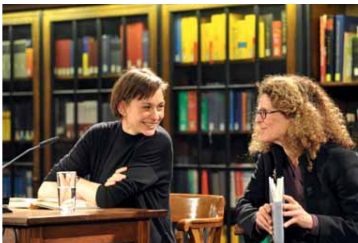
Christiane Paul, Leserin der deutschen Passagen, und Jaimy Gordon, Autorin des Romans »Die Außenseiter«.