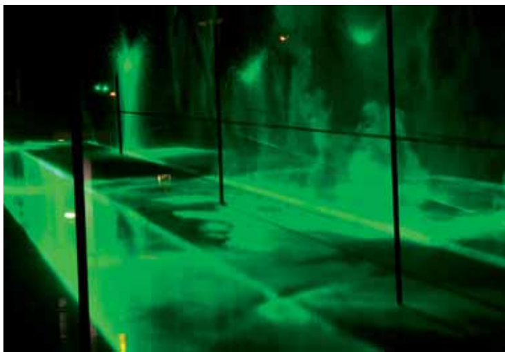
Laserereignis zur Luminale von Rainer Plum.

Regelmäßig beteiligen sich die beiden Häuser an den regionalen Großveranstaltungen wie zum Beispiel an der Museumsnacht in Leipzig und Halle oder an der »Langen Nacht der Wissenschaften«, bei der 100 Leipziger Labore, Hörsäle, Institute, Kliniken und Archive einen Schulterblick erlaubten. Das Frankfurter Haus nahm zum zweiten Mal an der Luminale, der Biennale der Lichtkultur, teil. Diesmal ließ der Künstler Rainer Plum auf dem