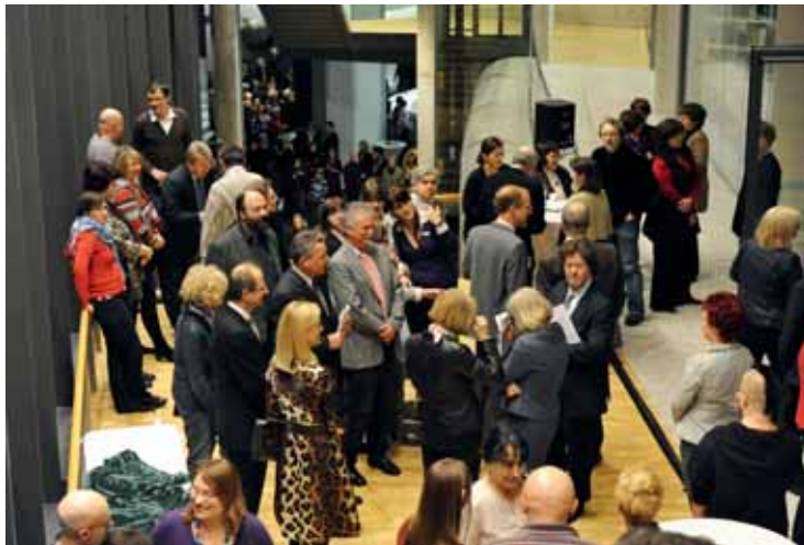
Eröffnungsfeier der neuen Dauerausstellung des Deutschen Buch- und Schriftmuseums.

»Die Schutzgeister der alten Buchstadt Leipzig haben derzeit viel zu tun. Sie müssen sich nicht nur über dem Rednerpult einfinden, wenn mit dem Festakt im Gewandhaus die Leipziger Buchmesse eröffnet wird. Sie haben schon am Vorabend am Deutschen Platz ihren Dienst begonnen, als dort im Erweiterungsbau der Nationalbibliothek die neue Dauerausstellung des Deutschen Buch- und Schriftmuseums eröffnet wurde. Und die Schutzgeister werden so schnell nicht zur Ruhe kommen, weil dies nur der Auftakt zu den Feierlichkeiten war, mit denen die Nationalbibliothek ihren 100. Geburtstag begeht«, so sah es die Süddeutsche Zeitung – sehr richtig – voraus.