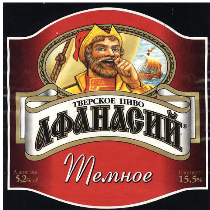
Abbildung 3: “Afanasij”-Bier aus Tver’ (Etikett)

Die sowjetische Editionspraxis alter Handschriften konnte und kann philologisch nicht befriedigen: diplomgetreue Editionen, in denen die ursprüngliche Schreibung so getreu wie möglich bewahrt wird, waren nicht üblich. So sind entsprechende Ausgaben für viele sprachwissenschaftliche Untersuchungen schlicht wertlos oder höchstens eingeschränkt nutzbar: die Orthographie wurde