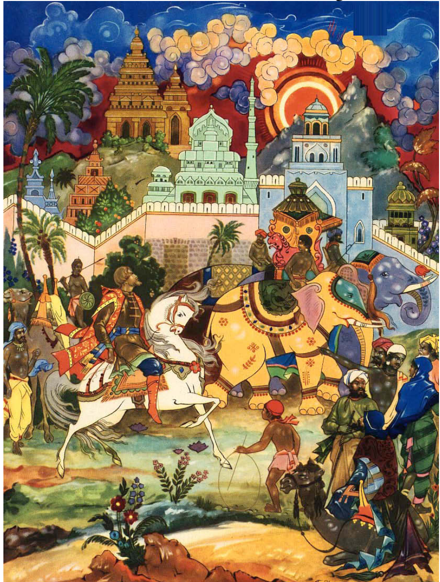
Abbildung 2: Afanasij Nikitin in Indien

Jahren in der Fremde übermannt ihn schließlich die Sehnsucht nach seinem Heimatland und er macht sich auf den Rückweg. Wieder schifft er sich ein, doch nach einem Monat ist das Boot weit vom Kurs nach Süden abgetrieben – nur dank vieler Gastgeschenke kommt man aus Äthiopien unbehelligt fort. Nachdem Persien wieder durchquert ist, wählt Afanasij Nikitin jetzt den Weg durch die Türkei, wo er als Spion beraubt und malträtiert wird. Schließlich kann er das Schwarze Meer, das dritte also, überqueren und erreicht