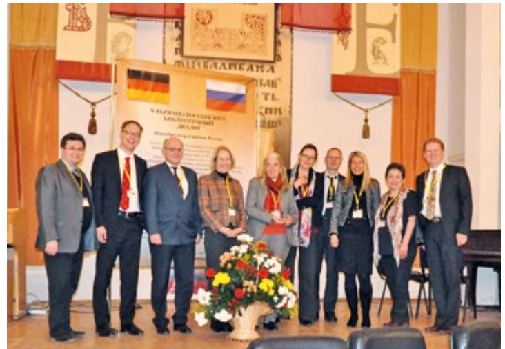
Teilnehmerinnen und Teilnehmer des fünften Deutsch-Russischen Bibliotheksdialogs in Saratow

Den Abschluss der Fachtagung bildete am 19. November ein dichtes kulturelles Programm, das den Besuch des Zentralarchivs der Wolgadeutschen und der Zentralen Kreisbibliothek in Engels ebenso umfasste wie einen Rundgang auf den Spuren der deutschen Kultur in Saratow, die Teilnahme an einem Lesewettbewerb und den abendlichen Besuch einer Aufführung von Wolfgang Amadeus Mozarts Zauberflöte in der Oper von Saratow.