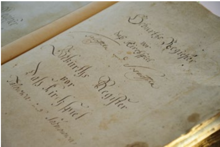
Geburtsregister aus dem Archiv der Wolgadeutschen, Engels

Drei Vorträge hatten Bestände der Regionalen Wissenschaftlichen W.-A.-Artisewitsch-Bibliothek der Staatlichen Universität Saratow zum Thema. Während es einerseits um die Geschichte und Rekonstruktion der Zentralbibliothek der Autonomen Sozialistischen Sowjetrepublik der Wolgadeutschen ging – ein Thema, in dessen Licht das Kulturprogramm des folgenden Tages stand –, gab der Stellvertretende Direktor der Bibliothek einen Einblick in die Bestände der Professorenbibliothek von Max Vasmer als ein Beispiel für das Schicksal einer Gelehrtenbibliothek.