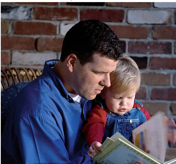
Sichere Bindungen zu den Eltern fördern das Partnerschaftskonzept

nauso oder ungefähr so erziehen, in der Erhebung von Zinnecker et al. (2002) sind es 73 Prozent. Demgegenüber möchten 27 Prozent ihre Kinder ganz anders oder anders erziehen (Zinnecker et al. 2002). Ein Viertel der Befragten