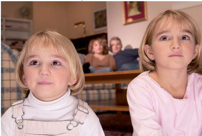
Familie als soziale und intime Beziehung mehrerer Generationen

In der Familienforschung ist die Definition ihres Untersuchungsgegenstandes problematisch (vgl. u. a. Ritzenfeld 1998; Petzold 1999). Je nach Disziplin wird der Schwerpunkt der Definition auf rechtliche oder biologische Elternschaft, die intimen Beziehungen, das Zusammenleben in einem Haushalt oder Strukturmerkmale von Familie gelegt. Im Folgenden wird eine Annäherung über psychologische Perspektiven unter Einbeziehung einer pädagogischen Definition hin zu einem Familienmodell erfolgen, in dessen Zentrum die familialen Wechselwirkungsprozesse stehen.