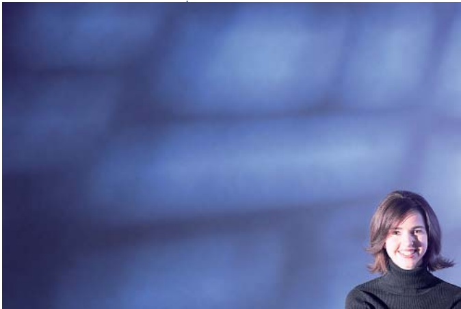
Weitergabe von Werten erfolgt vor allem zwischen Müttern und Töchtern

Zusammenhänge zwischen der Persönlichkeit der Eltern und den Familienkonzepten der Kinder und Jugendlichen wurden in der deutschen Forschung der letzten zehn Jahre – im Gegensatz zur internationalen – nicht untersucht. Erweitert man den Fokus um Kognitionen und Werte, wie es