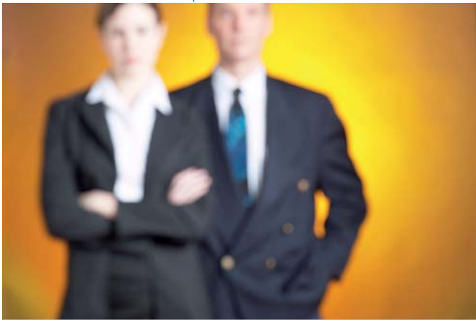
Qualität von Paarbeziehungen - hier lernen Kinder von den Eltern

jener der jungen Erwachsenen. Wendt und Walper (2006) konnten moderate Transmissionseffekte der elterlichen Partnerschaftsqualität auf jene der Jugendlichen feststellen.