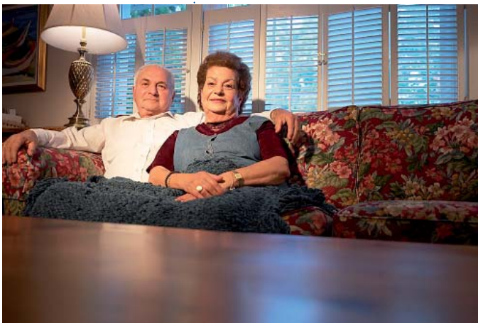
Demographischer Wandel als Herausforderung für Familienkonzepte

Neue Modelle der Generationensolidarität und Modelle der Verteilung gesellschaftlicher Ressourcen auf die verschiedenen Generationen werden notwendig. Solche Modelle lassen sich jedoch nicht nur von politischer Seite implementieren (Top-Down-Ansatz; Monitor Familienforschung, 2008; Arbeitsbericht Zukunft für Familie, 2008). Sie müssen auch von den Mitgliedern der jungen und alten Generation neu ausgehandelt und selbst gelebt werden (Bottom-Up-Ansatz).