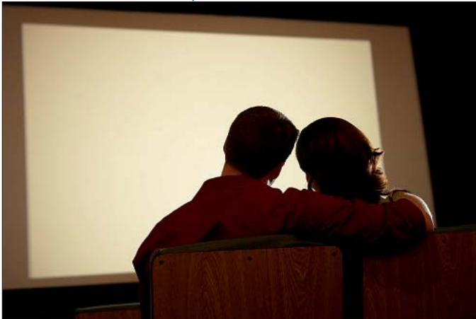
Klare Blickrichtung mit unklaren Inhalten - Familienkonzepte fördern

Die Durchsicht bisheriger Forschung ergibt bezüglich der leitenden Fragestellungen ein wenig einheitliches Bild. Während in einigen thematischen Gebieten übereinstimmende Befunde vorliegen, etwa zur Bedeutung von Bindung zu den Eltern, sind andere Aspekte bisher wenig erforscht.