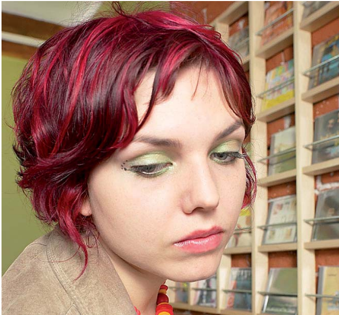
Beruf als Realbedingung - Familie als Wunsch bei Jugendlichen

der Erhebung in eine Real- und eine Wunschbedingung unterschieden. Im Ergebnis zeigte sich in der Realbedingung eine deutlich stärkere Gewichtung des Berufs und in der Wunschbedingung eine leicht stärkere der Familie.