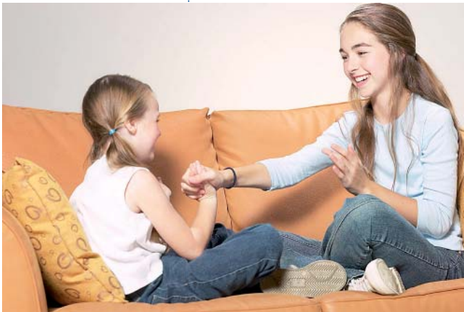
Die Zahl der Geschwisterbeziehungen beeinflusst Familienorientierung

Den Einfluss der Geschwister auf die Konstituierung von Familienkonzepten wird derzeit in geringem Maße untersucht. Einen Hinweis gibt die Studie von Brake (2003), in der jedoch keine Beziehungen im Zentrum der Analyse standen, sondern der Einfluss der Geschwisteranzahl. Demnach wiesen