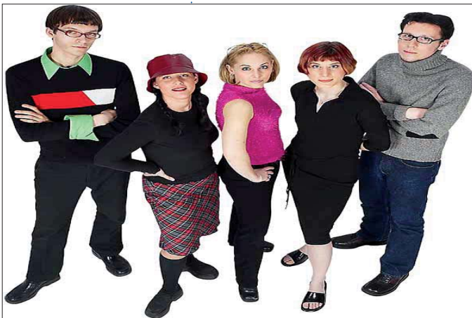
Bindung, Lernen am Modell oder Wertewandel? Unklare Ursachen!

Bei jenen Jugendlichen und jungen Erwachsenen zeigten sich negative Auswirkungen auf die Qualität der Partnerschaften, die Entscheidung für eine Partnerschaft (Ambivalenz) sowie ein früheres Eingehen einer (sexuellen) Beziehung und geringere Beziehungsinvestitionen.