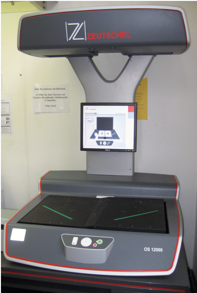
Abb.: 1: Buchscanner

dere den Gästen den Arbeitsaufenthalt und die Rückkehr in ihre Heimat im wahrsten Sinne des Wortes zu erleichtern, verfügt die Bibliothek über einen Buchscanner. Hiermit kann die für den eigenen Gebrauch