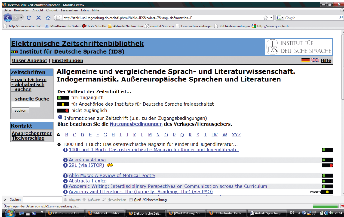
Abb. 3: EZB-Zugang der Bibliothek des Instituts für Deutsche Sprache mit IDS-Logo

in einer zentralen Datenbank erfasst. Nachgewiesen werden sowohl frei zugängliche als auch lizenzierte Volltextzeitschriften. Da die EZB den teilnehmenden Bibliotheken die Möglichkeit bietet, auf eigene Abonnements elektronischer Zeitschriften zuzugreifen, sind alle E-Journals der IDS-Bibliothek auch hier 15 zu finden.