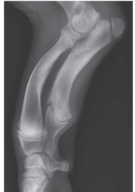
Abb. 2 Berner Sennenhund, männlich, 5 Monate alt. Radius-Curvus-Syndrom und damit einhergehende Außenrotation der Vordergliedmaßen infolge einer Kalziumübersversorgung.

Vorsicht ist auch bei sogenannten „Reinfleischdosen“ geboten. Viele Hundehalter übersehen hier, dass es sich lediglich um