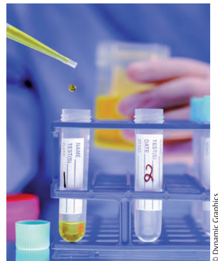
Abb. 1: UTI: Noch keine Empfehlung für Phytotherapeutika in Leitlinien.

Unkomplizierte Harnwegsinfekte, Biofilm, Virulenzfaktoren, pflanzliche Durchspülmittel, Harnwegsdesinfizienzien