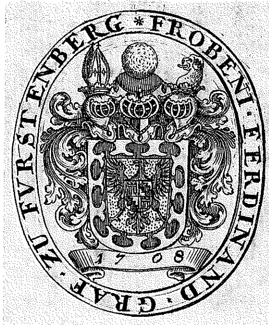
Exlibris Froben Ferdinand Graf zu Fürstenberg, 1708.

Die Säkularisation der Klöster hatte erhebliche Auswirkungen auf den Buchmarkt und das Bibliothekswesen. Große Buchbestände gerieten in den Handel und zugleich entstanden an den Universitäts- und Landesbibliotheken durch den Zustrom der Bücher aus den Klosterbibliotheken umfangreiche Dublettenbestände, die ebenfalls in den Handel gegeben wurden. Bibliophile wie der Frankfurter Arzt Georg Kloss konnten sich an einem reichen Bestand bedienen. Erlesene Stücke aus der Bibliothek von Kloss finden sich in der Sammlung des württembergischen Ministers Eugen von Maucler (1783 – 1859) auf Schloss Oberherrlingen bei Ulm wieder, die offenbar im frühen 20. Jahrhundert aufgelöst wurde. Der Inkunabelspezialist Paul Needham (Princeton) hat mir freundlicherweise aus seiner privaten Zusammenstellung der Inkunabelbesitzer über 40 Inkunabeln der meist durch ein Exlibris E.M. mit der Jahreszahl 1839 kenntlichen Oberherrlinger Bibliothek nachgewiesen. Einer der Frühdrucke stammt aus einer oberschwäbischen geistlichen Bibliothek; aus Waldsee (Huntington-Library San Marino: Mead 1609).