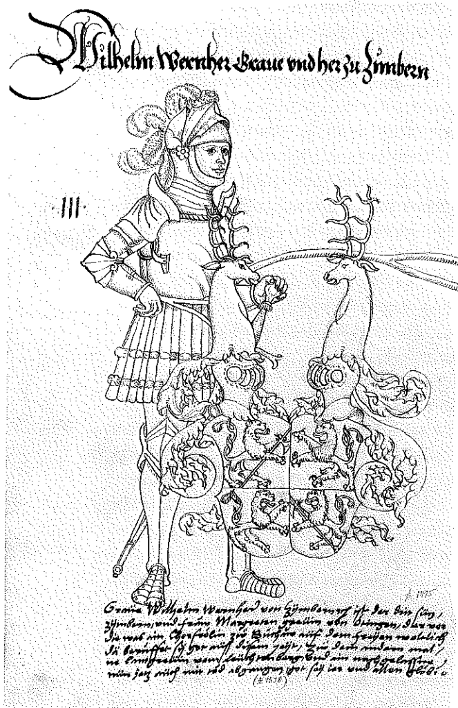
Wilhelm Werner Graf von Zimmern. Federzeichnung in: Ders.: Genealogie der Grafen von Kirchberg, vor 1546.