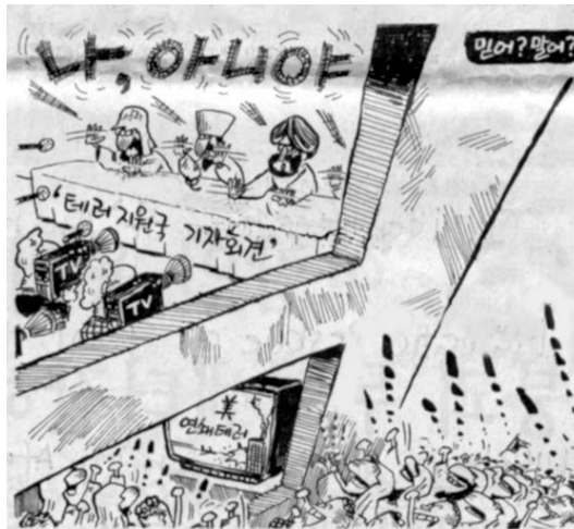
Karikatur 2: Chosun Ilbo 13.9.2001

Obwohl Chosun Ilbo prozentual und absolut mehr Artikel über militärische Operationen und Strategien druckt als alle anderen Zeitungen, finden sich in der Kommentierung so wenig Aussagen zu diesem Thema wie in keinem der anderen Blätter. Die militärische Reaktion der USA wird ebenso wenig diskutiert, wie Maßnahmen zur Bekämpfung des Terrorismus. Nur in wenigen Kommentaren sind Bewertungen enthalten, welche sich aber dann implizit oder explizit gegen militärische Operationen aussprechen. Diese Ablehnungen sind aber weniger stark als in Hankyoreh . Auffällig ist eine positive Grundstimmung gegenüber den USA, die besonders im Vergleich zu Hankyoreh ins Auge sticht. US-amerikanische Werte finden in den Kommentaren starke Betonung, werden hochgehalten und positiv beschrieben. Aus