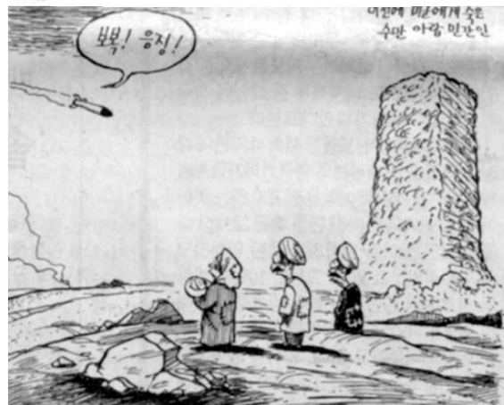
Karikatur 1: Hankyoreh 15.9.2001