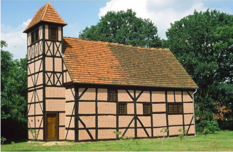
Dorfkirche Roddan nach dem Wiederaufbau (Foto: Dr. Uwe Czubatynski, 1998).

Quellen so erschlossen werden, dass sie als zuverlässige Hilfsmittel der historischen Forschung betrachtet werden können. 3