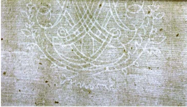
Unterer Teil des Wasserzeichens im Durchlicht.

3 Kossäten aus. 7 Aufschlussreich sind zweifellos auch trotz aller Zufälligkeiten und Deutungsschwierigkeiten die im Kirchenbuch angegebenen Todesursachen. Nicht zu vergessen sind schließlich Rückschlüsse, die sich auf das kirchliche und schulische Leben jener Zeit ziehen lassen (Patenamt ab dem 15. Lebensjahr, das Amt zweier Kirchenvorsteher, sechsmalige Abendmahlsfeier im Jahr, Leichenpredigten nur für Bauern). 8