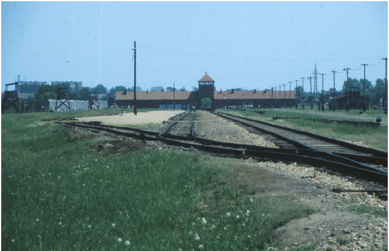
Lagertor in Brzezinka (Birkenau) im August 2001 von der Rampe aus.

Die Exklusion setzt den Einschluss durch eine Öffnung hindurch voraus. Lager werden durch architektonisch auffallend konstruierte Toranlagen betreten, die zu einem ungedeckten, gefangenen Raum führen. Dort sind vorwiegend temporäre Bauten planmäßig gruppiert, Zelte, demontierbare Baracken und Ställe. Die Freiräume sind von Zäunen und anderen Sperranlagen umzingelte Fanghöfe, nur durch das bewachte Eintrittstor zu verlassen, oder nicht.