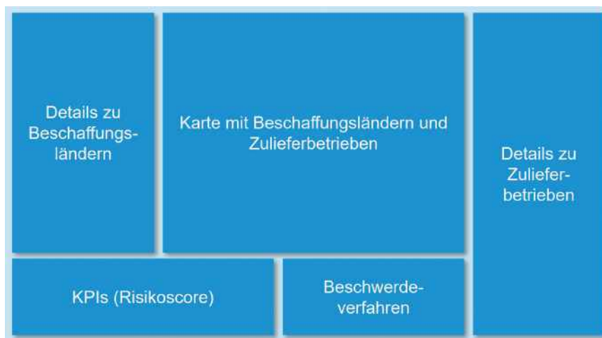
Abb. 1: Entwurf eines Benutzerflächenlayouts für Dashboards im Sinne des LkSGs (eigene Darstellung)

Aufgrund der rechtlichen Anforderungen ist es wichtig, Best-Practice-Konzepte für die Dashboarderstellung zu entwickeln. Dazu gehören beispielsweise die Software-Auswahl, das Benutzerschnittstellendesign und die eingesetzten Informationsvisualisierungen. Für die Entwicklung von Lieferketten-Dashboards können eine Reihe von Dashboard-Softwareprodukten wie ArcGIS Dashboards, Tableau oder Microsoft PowerBI eingesetzt werden. Abbildung 2 zeigt ein mit ArcGIS Dashboards erstelltes Lieferketten-Dashboard, welches sich besonders gut für die Erstellung von Geoinformationsdashboards eignet.