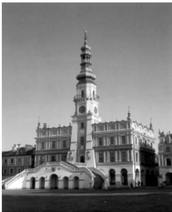
Rathaus von Zamosc

Nezach Jisrael sucht mit dem Licht der Wissenschaften Passagen des Talmud zu beleuchten, die wissenschaftlichen Wahrheiten zu widersprechen scheinen. Allerdings sind Israels wissenschaftliche