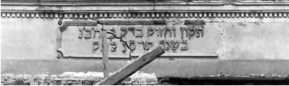
Fassade der Synagoge von Brody.

Royal Society und der Académie royale des sciences ist ebenfalls von einer Ideologie motiviert, für die die Zurückweisung des mittelalterlichen Erbes ein wesentliches Element bildet. Und da haben wir R. Israel b. Moses, der anno 1744 genau diese mittelalterliche peripatetische Philosophie gebraucht, um in das Judentum Begriffe der neuen Wissenschaft einzuführen. Weit davon entfernt, als nutzlose Relikte ruhmloser Vergangenheit ausgesondert zu werden, werden die alten idola vielmehr erneut eingesetzt, instrumentalisiert als Vehikel zur Einbringung neuer Ideen in die jüdische Zitadelle.